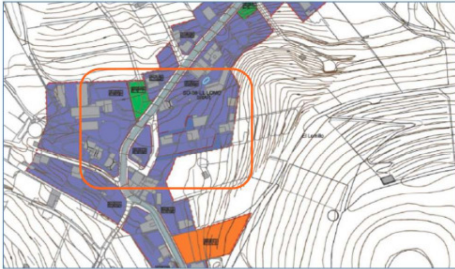
Plano de ordenación pormenorizada del PGO vigente en el AR El Lomo

Modificación menor 3: Revisión de la ordenación de ciertos viarios en el Asentamiento Rural El Naciente (AR14).