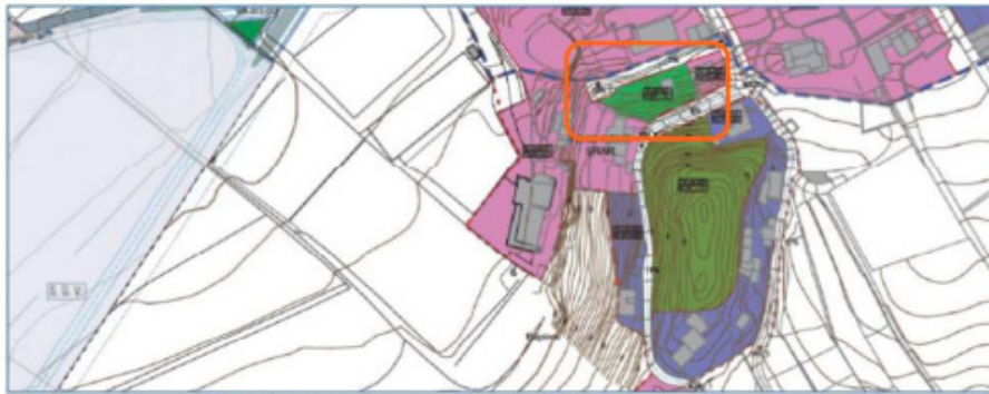
Plano de ordenación pormenorizada del PGO vigente en el AR Roma

La modificación tiene por objeto revisar la ordenación para evitar la afección a vivienda existente con calificación de espacio libre del asentamiento.