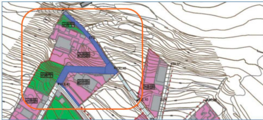
Plano de ordenación pormenorizada del PGO vigente en el AR El Naciente

La modificación tiene por objeto revisar la ordenación viaria del asentamiento, para incorporar un viario público no recogido en la ordenación del PGO.