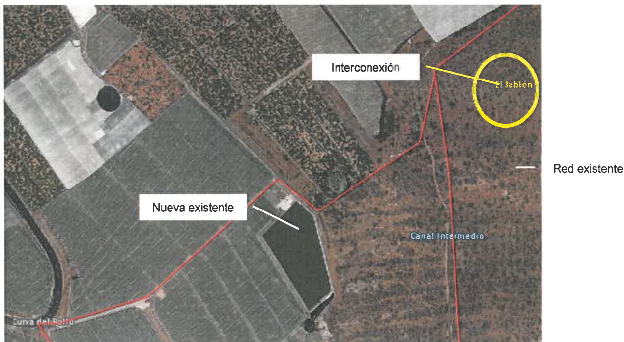
Imagen: Punto de partida de la nueva red.

Justo en el punto ubicado al norte de la Montaña de La Laguna, la conducción existente está constituida de acero galvanizado de 80 mm de diámetro. Tratándose este punto de la red existente desde donde se prevé que parta la nueva conducción.