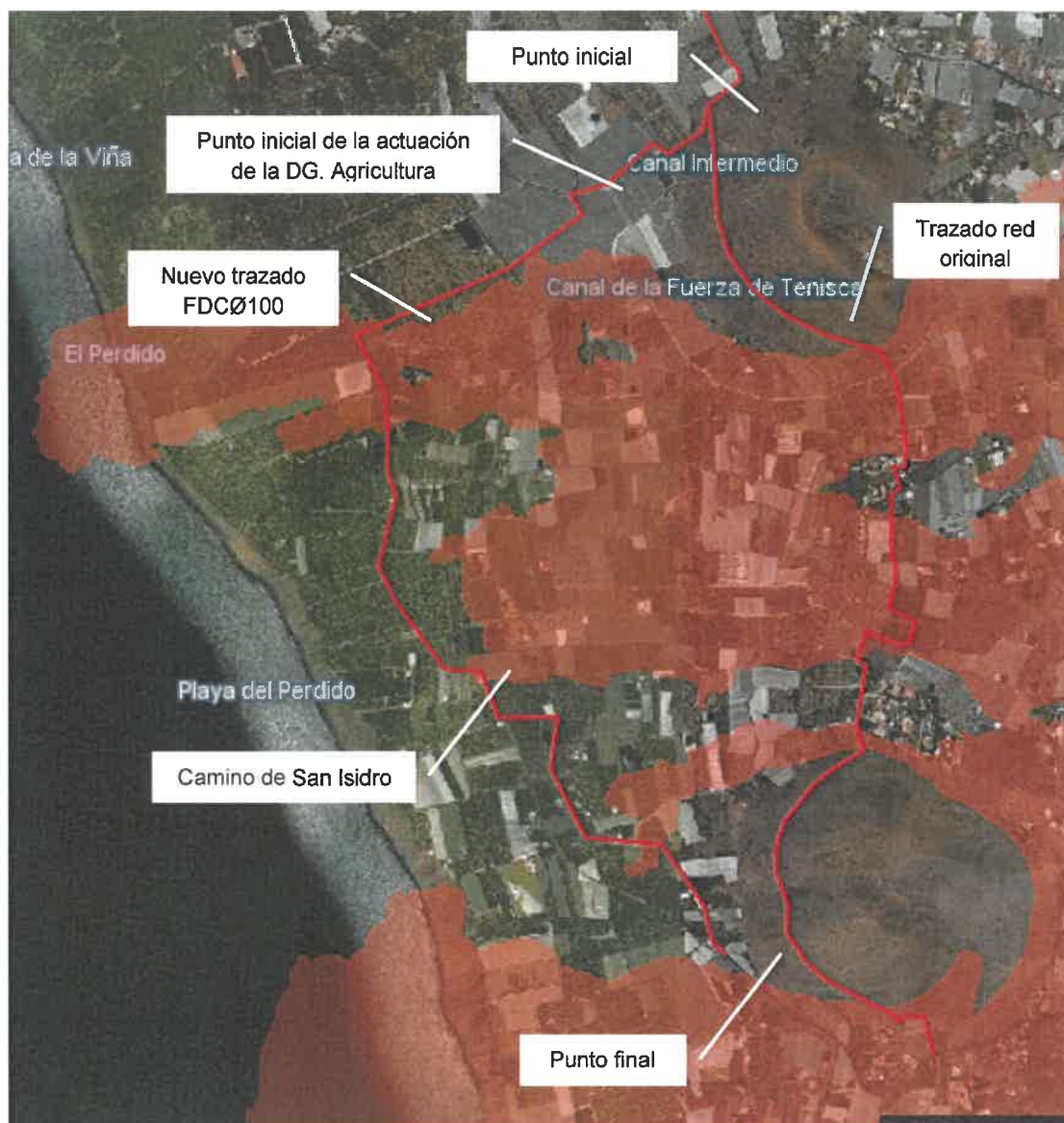
Imagen: Trazado propuesto.

De estos 3,5 km, salvo los primeros 450 m, el resto del trazado es coincidente con otra actuación promovida por la Dirección General de Agricultura del Gobierno de Canarias, que tienen por objeto la restitución del abastecimiento del riego agrícola de las áreas desabastecidas en el mismo ámbito territorial. Dicha actuación, según la información trasladada por los responsables técnicos de esa Dirección General, se prevé que de comienzo en un breve espacio de tiempo.