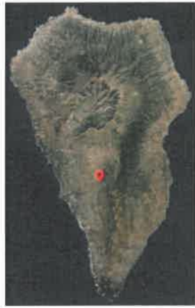
Imagen: Ubicación del volcán.

La destrucción de estas infraestructuras a su vez está originando situaciones de desabastecimiento de servicios esenciales , como es el suministro de agua potable a la población o riego agrícola , así como el de otros servicios como el suministro energético, telecomunicaciones, transporte viario, etc.