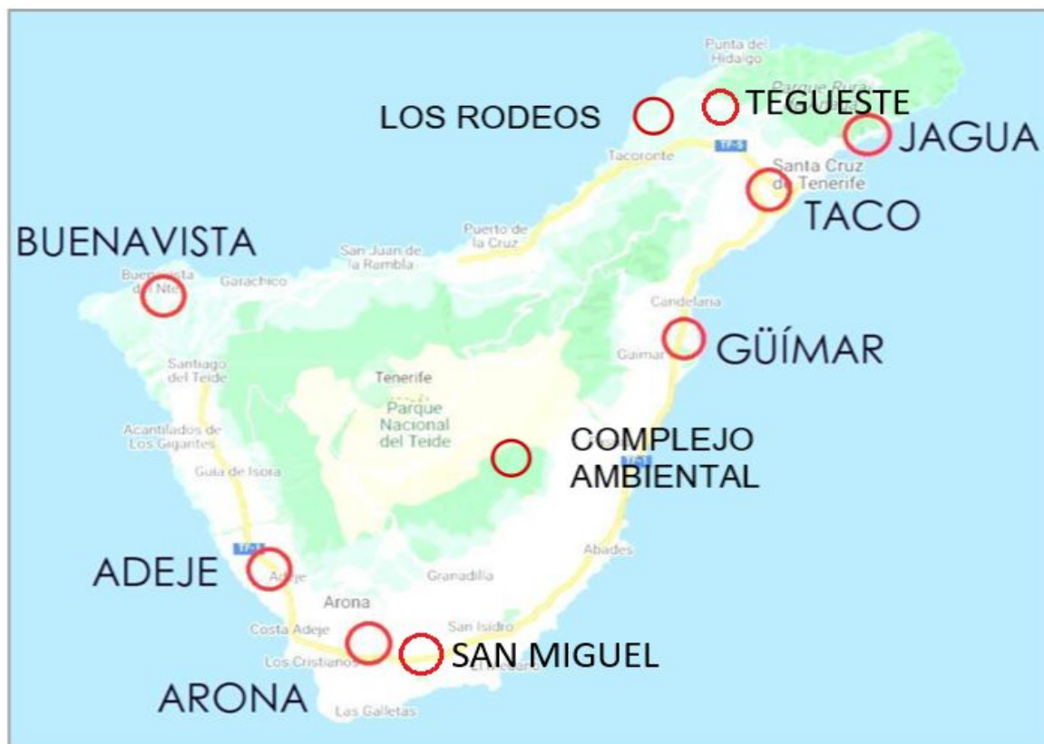
Plano 1. Ubicación de los Puntos Limpios gestionados por GESPLAN, S.A.

* Prevista su puesta en funcionamiento durante el segundo semestre de 2026 (Arico, Tegueste y San Miguel) y primer semestre de 2027 (Los Rodeos).