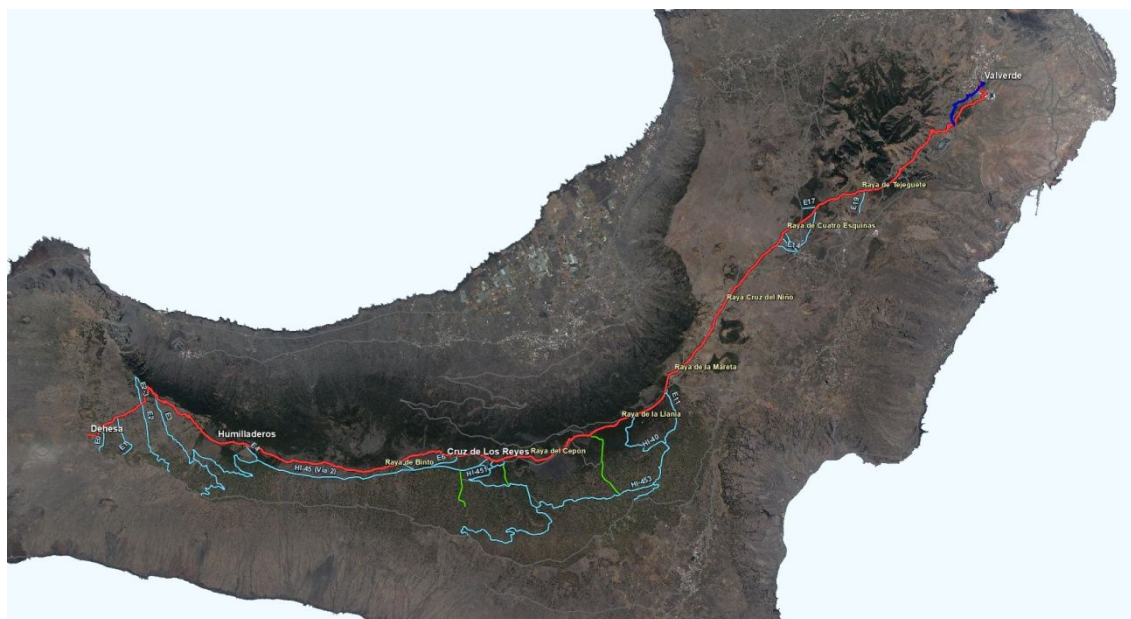
Imagen 1. Trazado Camino La Virgen, pistas y vías

Las actuaciones que se pretender acometer en la trama del Camino de La Virgen tienen una dimensión de 28 km aproximadamente en el tramo de bajada, más 1 km diferenciado en la celebración de la subida.