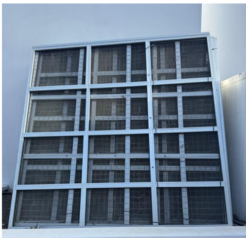
Imagen 1: detalle de los paneles.